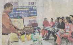
छात्राओं को एक्सपर्ट देंगे ट्रेनिंग।