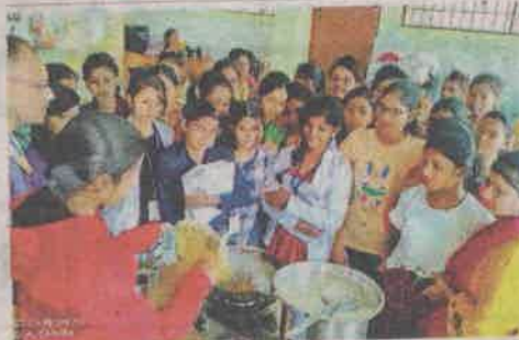
गर्ल्स कॉलेज दुर्ग में छात्राओं ने सीखी तकनीक।