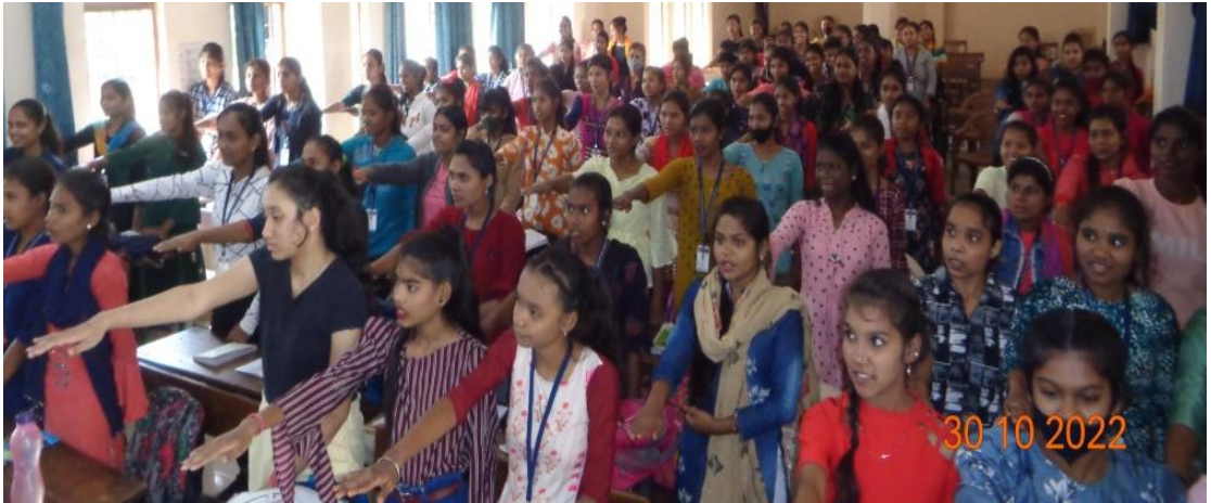
एकता की शपथ